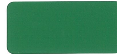
CB12 オリーブグリーン